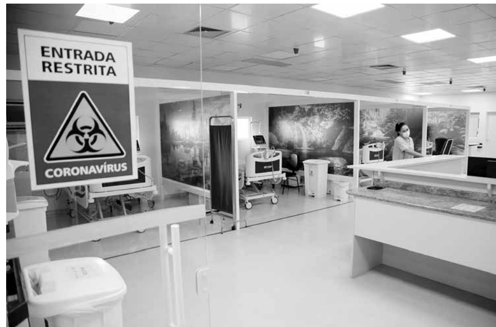
Novos leitos estão sendo providenciados pelo Governo do Estado e novas ações restritivas devem ser anunciadas ainda hoje.